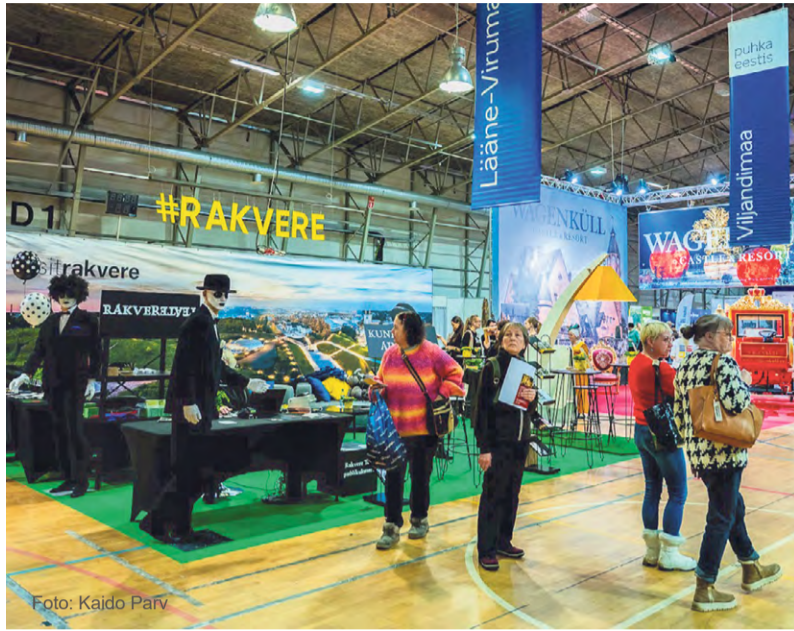
Rakvere linna boks Tourestil.

Rakvere kuulub rahvusvahelisse kestlike ja jätku- suutlike turismisihtkohtade võrgustikku ning linn peab oluliseks turismi järjepidevat arendamist ja piirkonna nähtavuse suurendamist.