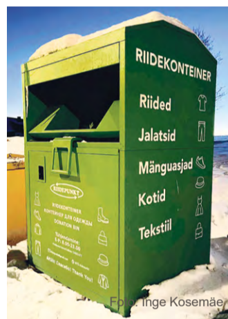
MTÜ Riidepunkti konteiner.

NB! Riidekonteinerisse peaks panema ainult puhtaid ja terveid esemeid. Sobivad nii riided, jalatsid, mänguasjad, kodutekstiil ja aksessuaarid. Riidekonteinerisse nagu nimest näha - ei sobi tehnika, nõud ega muud kodukaubad.