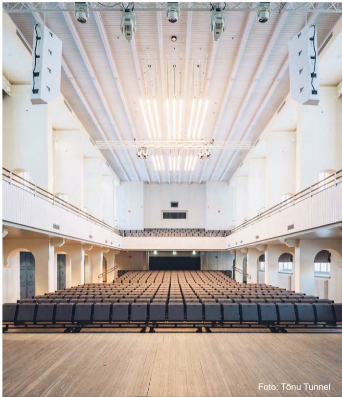
Suur saal Fratres.