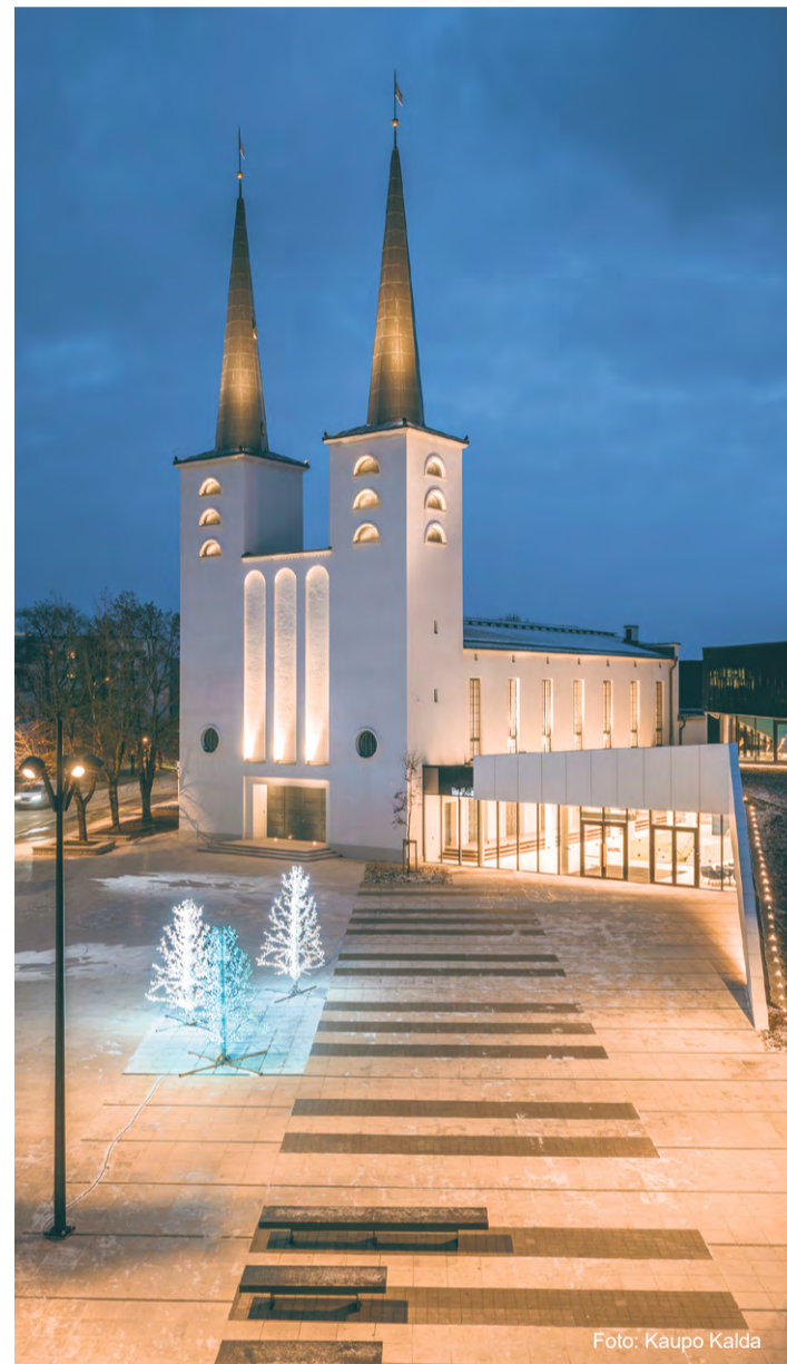
Arvo Pärtille pühendatud muusikamaja Ukuaru.