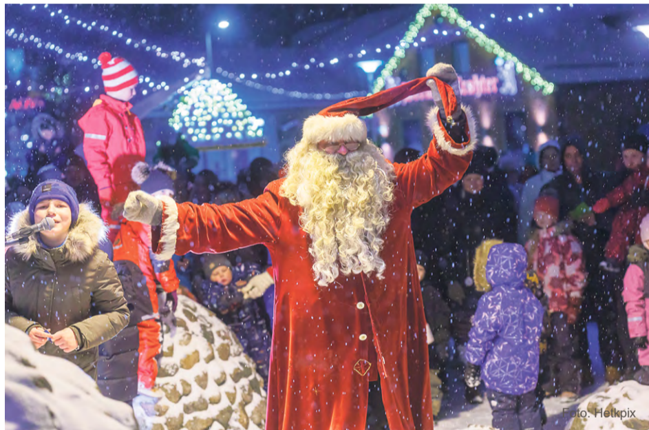
Jõulutulede süütamisel on kohal ka jõuluvana.